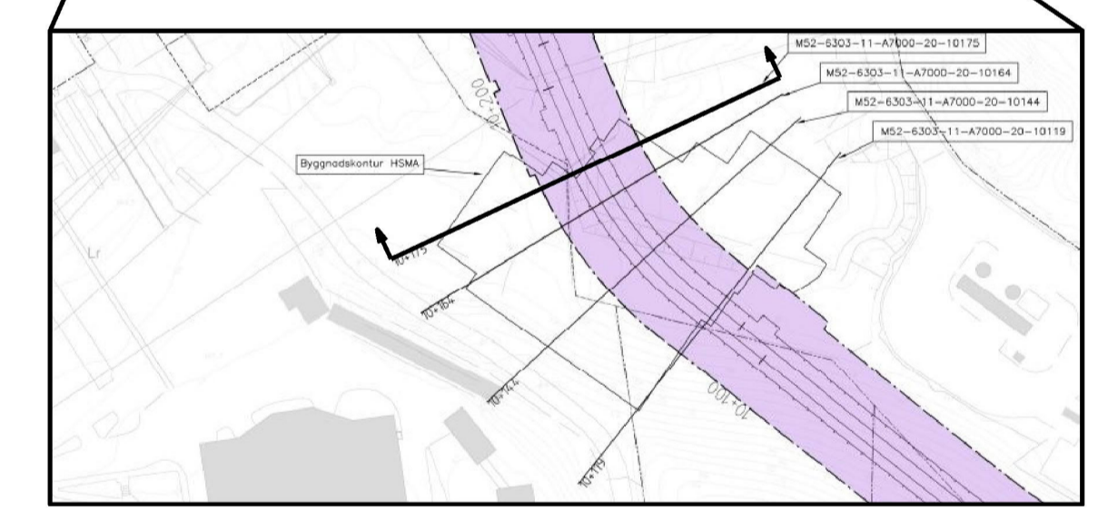
REDOVISAD TVÄRSEKTION I PLAN