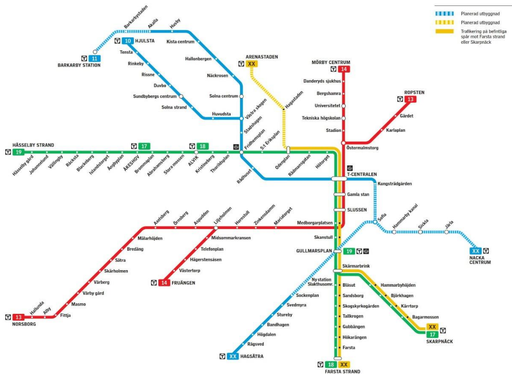
Figur 1. Framtidens spårtrafikkarta. Blå streckad markering visar aktuell sträckning för planerad utbyggnad.

Tunnelbanan är en hållbar trafiklösning som behövs för framtiden. Både Nacka kommun och Stockholms stad växer och kommunerna har också vuxit samman alltmer. Utbyggnaden av tunnelbanan ger möjlighet för Hammarby Sjöstad, östra Södermalm, söderort och Nacka att växa på ett hållbart sätt.